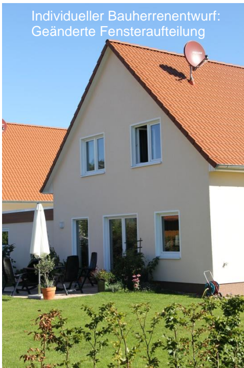
Individueller Bauherrenentwurf: Geänderte Fensteraufteilung

Schon für € 187.400,- in der Classic - Ausstattung