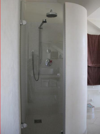
Beispiel einer Individuellen Badausstattung

Schon für € 230.800,- in der Classic - Ausstattung