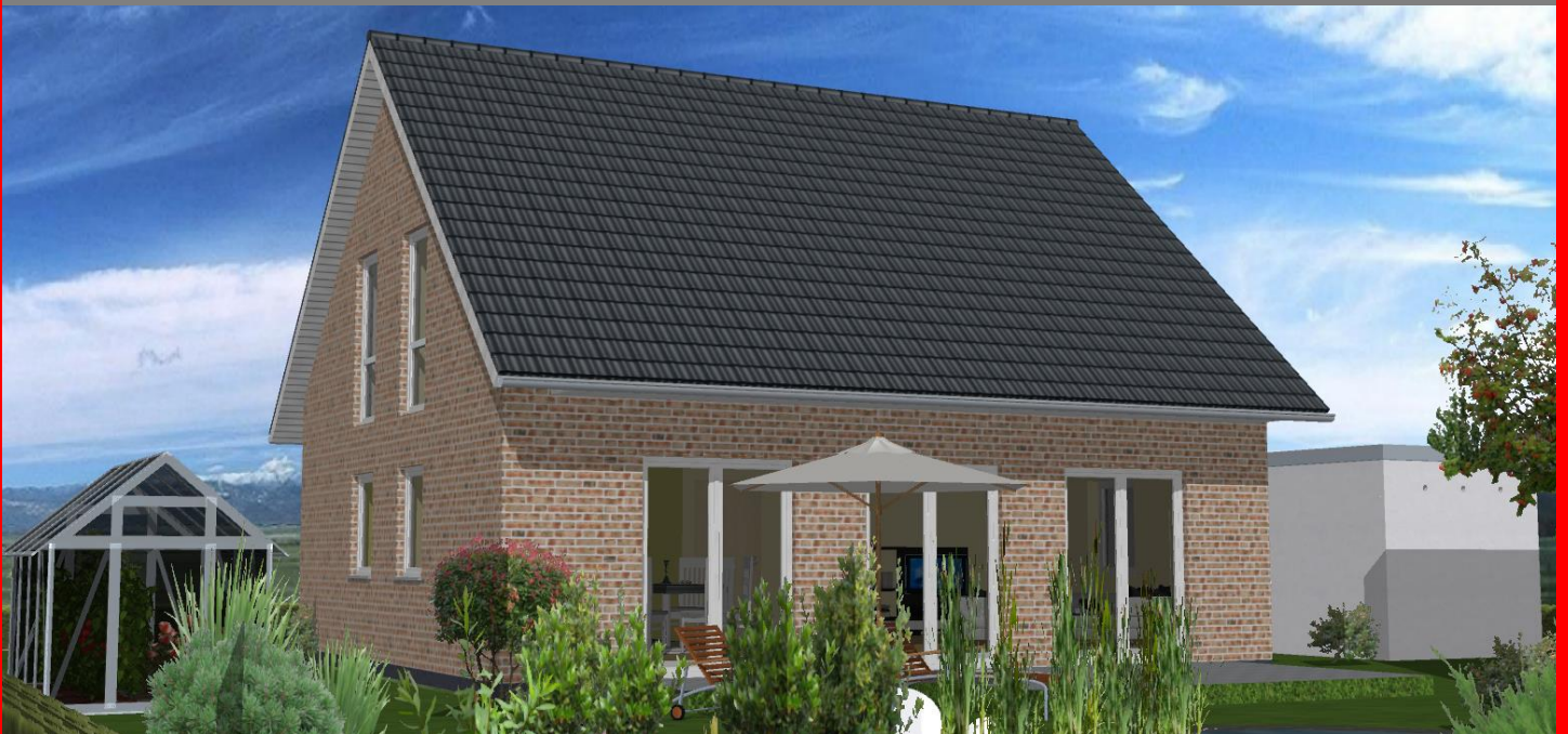
Easy Line M

Dieses schöne Satteldachhaus überzeugt auf rund 114 m 2 Wohnfläche durch seinen zeitlosen Auftritt. Wie bei allen Vorschlägen dieser Serie können Sie auch hier die Ausstattung Ihren Wünschen entsprechend erweitern, oder durch Eigenleistung sparen.