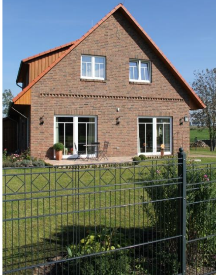
Beispiel einer individuellen Ausstattung: Ziermauerwerk