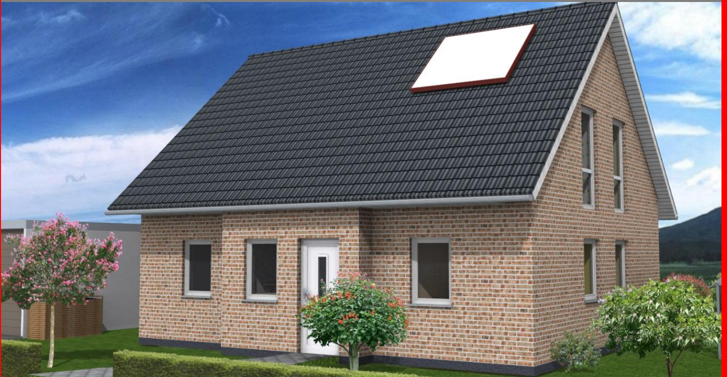
Easy Line M