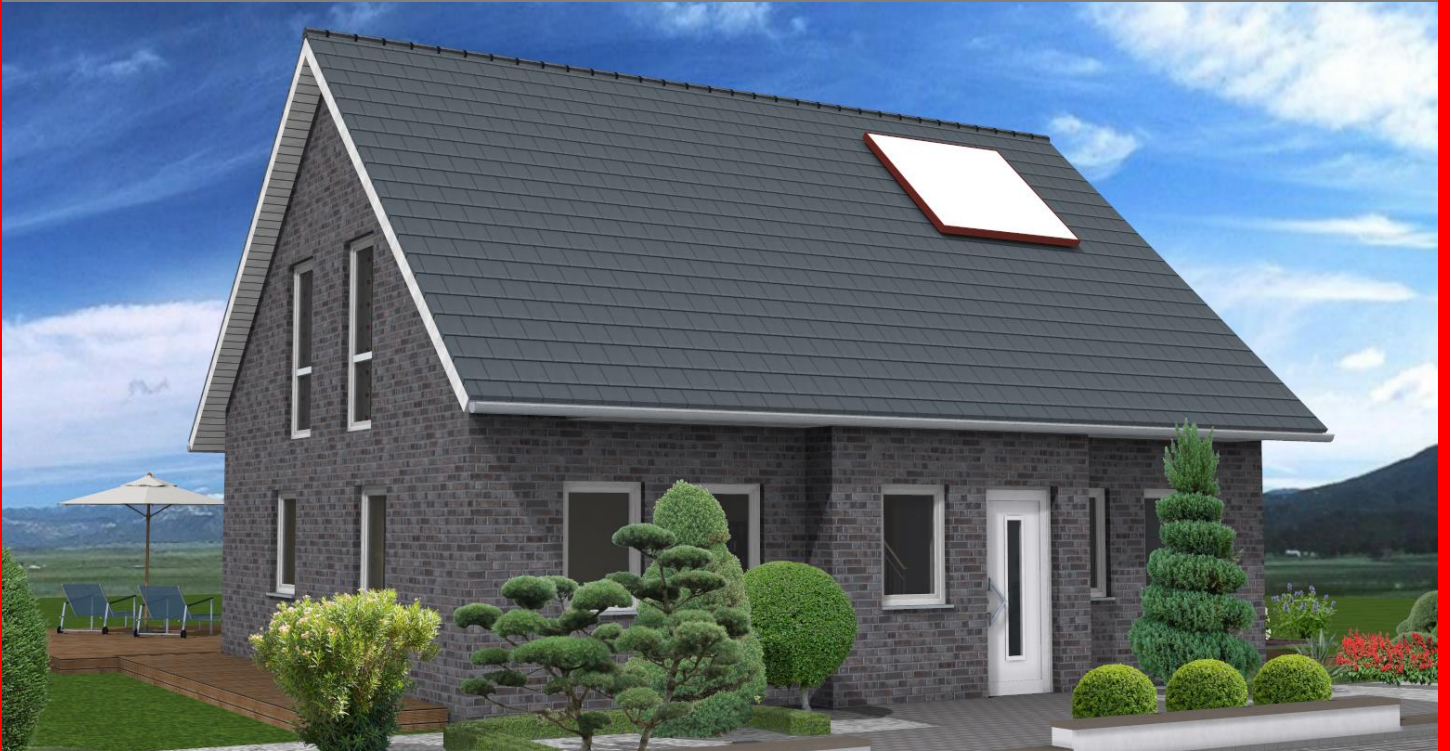
Easy Line L