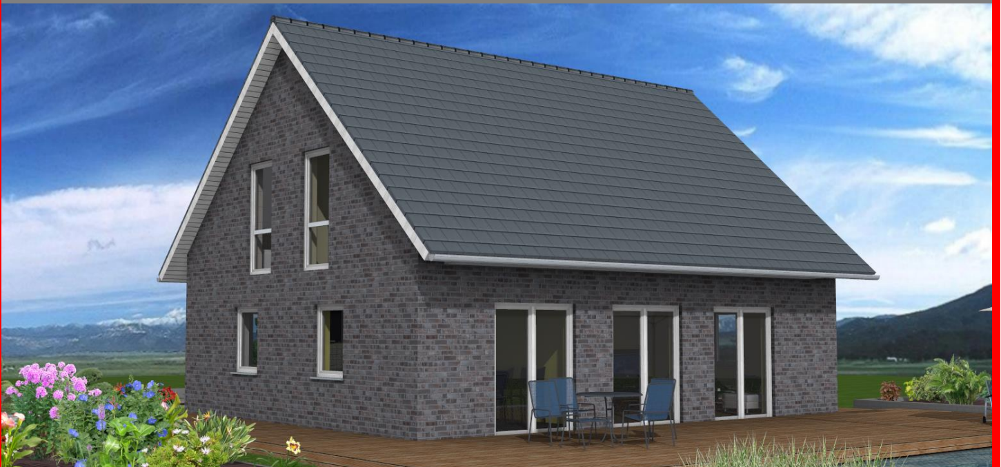
Easy Line L

Hier wird ein offenes und junges Wohnkonzept auf über 122 m 2 umgesetzt. Geschaffen wurde ein heller Lebensraum für die ganze Familie. Zudem finden Sie im Erdgeschoss ein Gäste- oder auch Arbeitszimmer, das Ihnen die nötige Ruhe bietet.