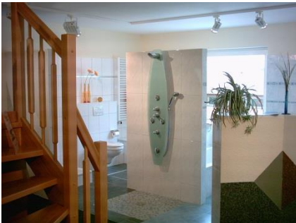
Blick in unsere Ausstellung