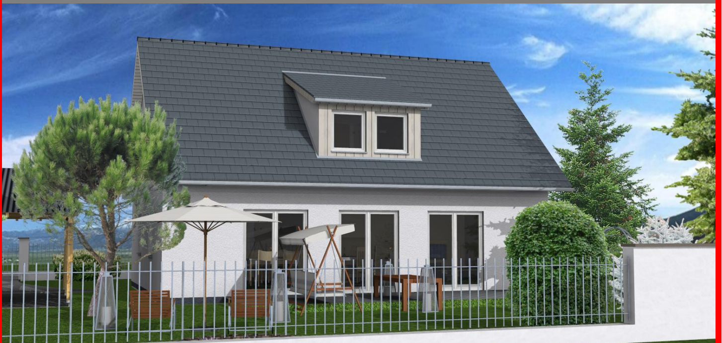
Easy Line XL

Massive Ziegelbauweise, helle, freundliche Räume und mit rund 134m 2 viel Platz auch für die größere Familie. Dazu moderne Haustechnik z.B. auch mit Wärmepumpe, Solarkollektoren, Photovoltaik und natürlich mit bewährten Verarbeitungsmethoden und erprobten Baustoffen.