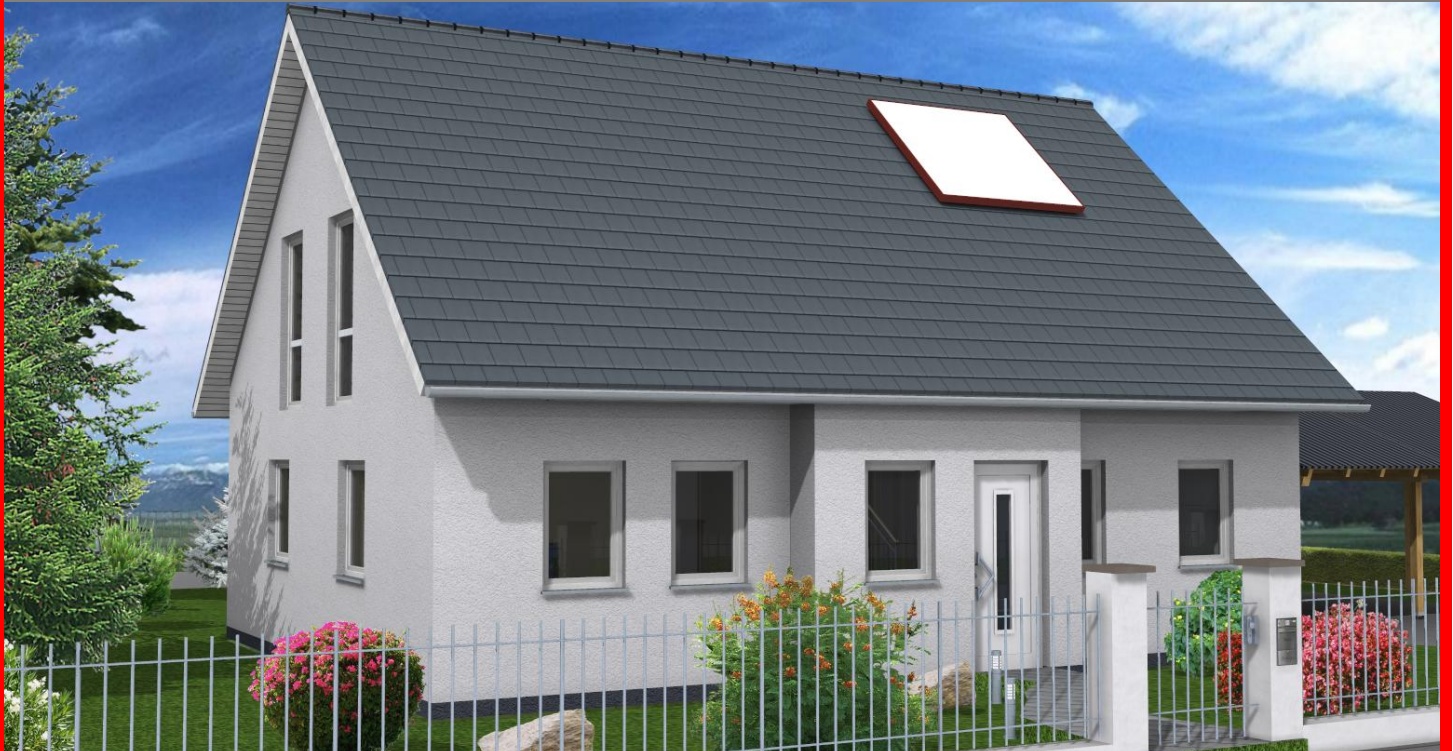
Easy Line XL