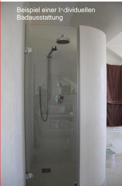
Beispiel einer Individuellen Badausstattung